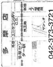
多摩センター店外観