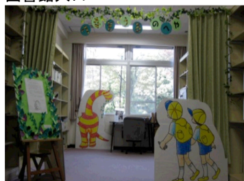
へなそうるのへや