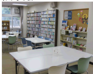
ティーンズコーナー