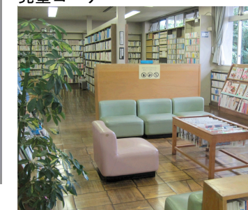
新聞・雑誌コーナー