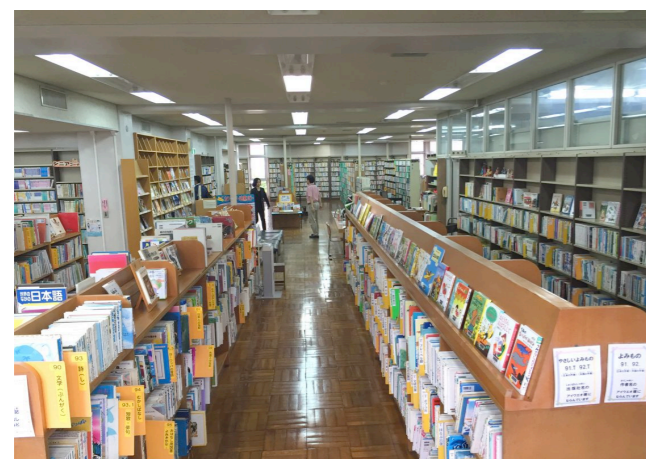
書架間のゆとりがある児童開架室