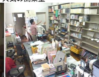
せまいが機能的配置