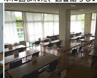
人気の学習閲覧室