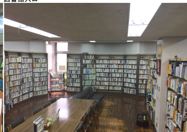
本に囲まれた、図書館らしい人気の開架室