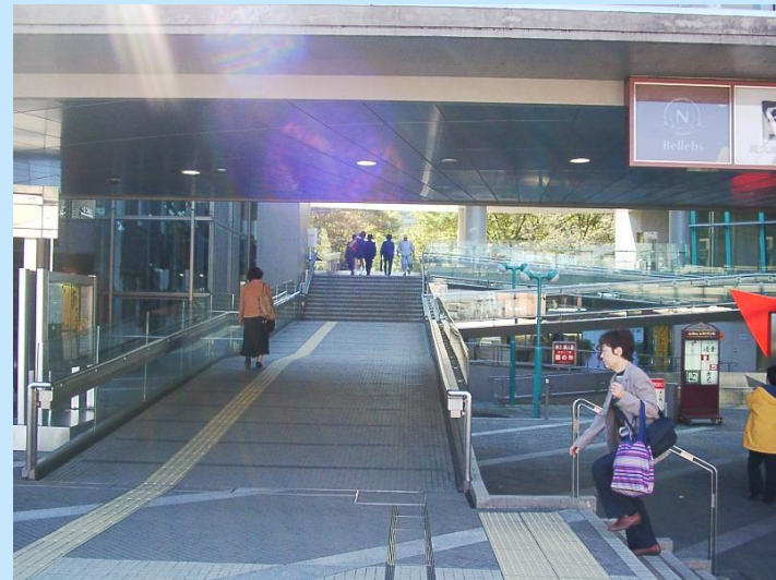
突き抜け開放して、明るさ確保