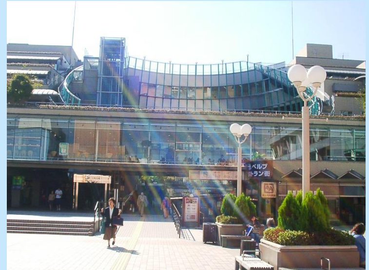
ガラスを駆使して、閉鎖的にならない配慮