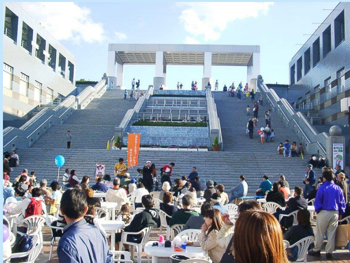
● 中央公園へのアプローチは確保（期待感）