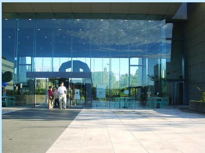
白山神社の緑の借景・陽光のさすロビー