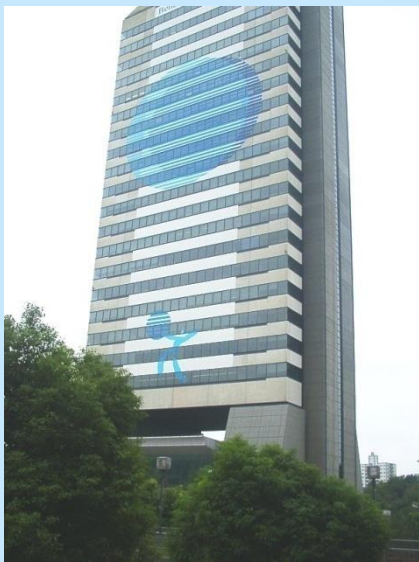
ベネッセ本社 北入り建物