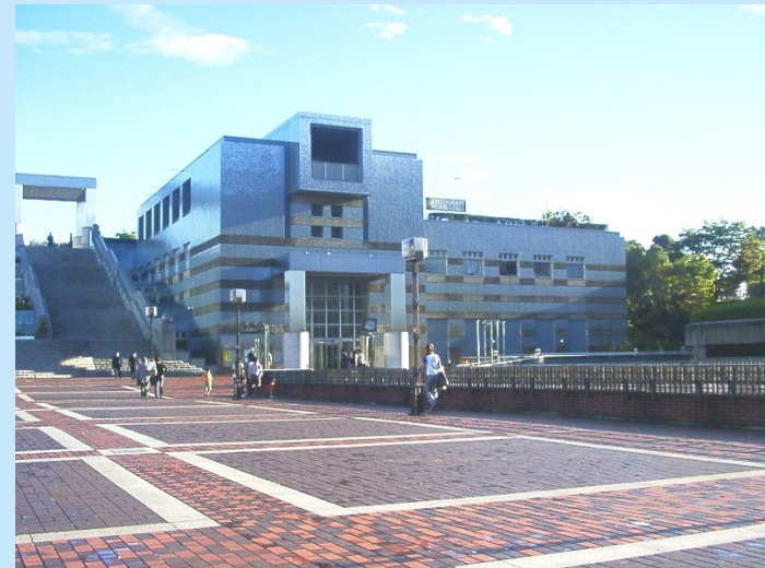
● 公園施設→抑える→東南西側が擁壁の条件→厳しい計画条件 ●