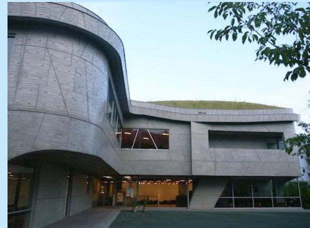
晴天時は、入館時に明暗の調整が厳しい