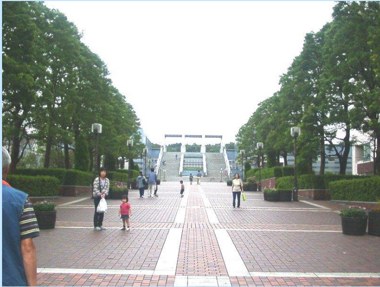
レンガ通りの視界を開放。パルテノン多摩を分断。 スロープ勾配 1/12の試み