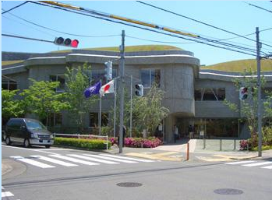
唐木田菖蒲館（コミュニティーセンター） 北アプローチ、暗い