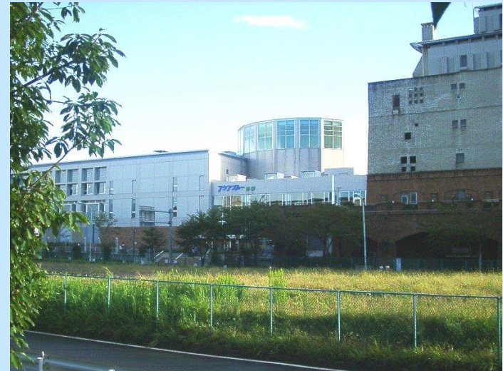
アクアプール、同じ設計者なのに景観づくり？