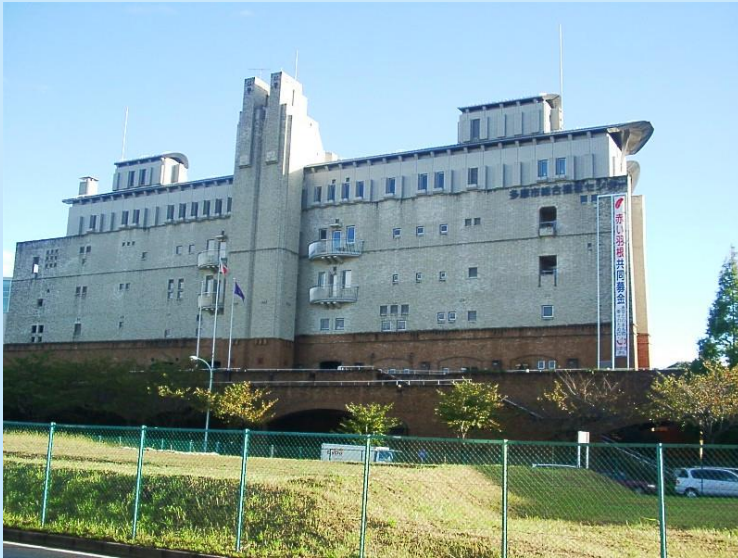
多摩市総合福祉センター 北アプローチ、暗い