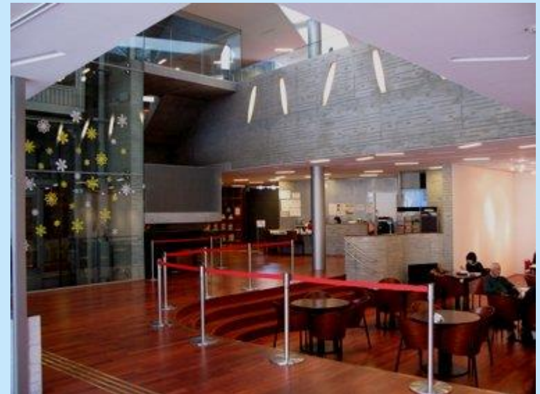
床材が暗く段差の転倒防止