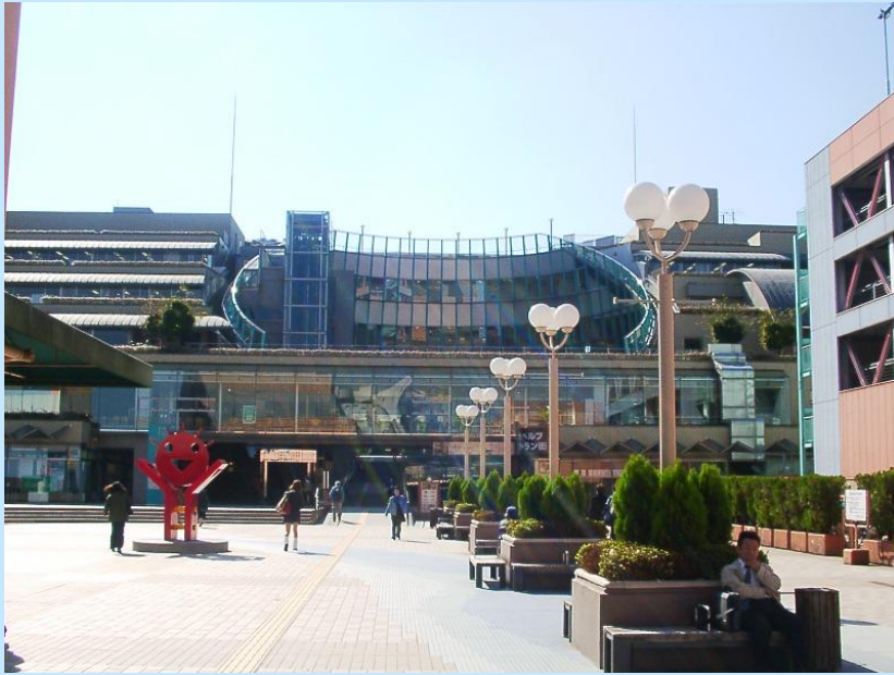
ベルブ永山 北入り建物 坂倉建築研究所設計