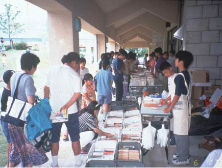
ライブラリーフレンズが「本のリサイクル市」

多摩市の40年の図書館政策は、図書館を良く知りよく利用する市民を育てました。市民も生涯学習や自己実現を求めて、お話会や点訳朗読奉仕や催事の協働など、図書館での活動を広げました。中央図書館が出来ることで、より多くの多様な市民が、図書館で活動を展開するでしょう。こうした市民の生涯学習やボランティア活動をコーディネートする担当が図書館に必要です。また催事などでは市民の側にも、協働という「こと」のデザインを想像して展開させる、図書館フレンズのような活動もありそうです。