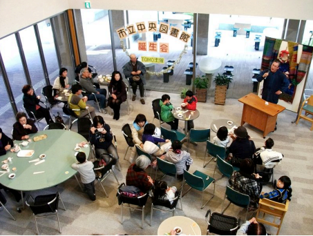
市民が「図書館の誕生日」を祝う