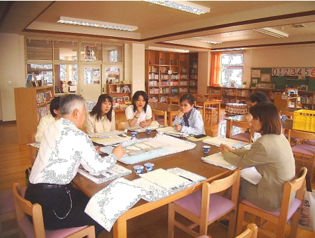
学校図書館司書さんと一緒に「図書館研究会」