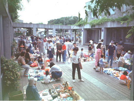
図書館パティオの日曜日「フリーマーケット」