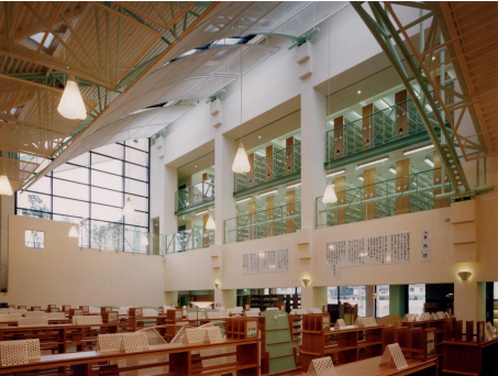
開架室の奥、見えて入れる公開書庫という形式