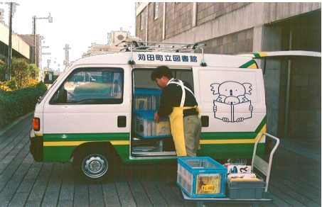
ブックコンテナで700冊を乗せて出掛ける配本車