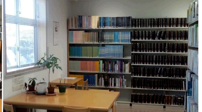
学習・閲覧スペース