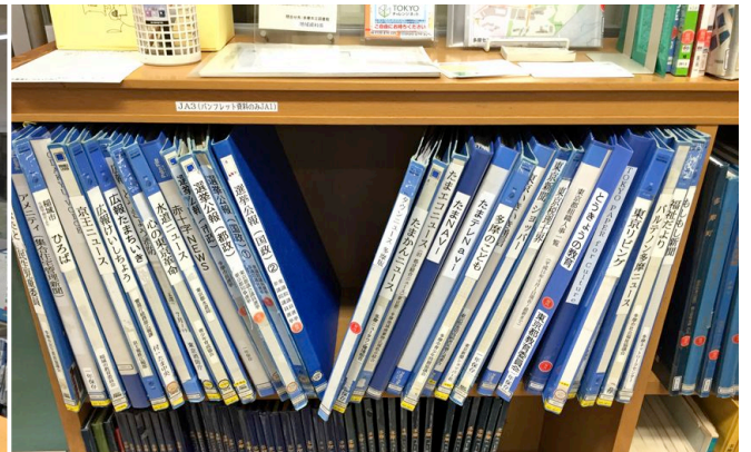
地域のニュース・広報などの収集