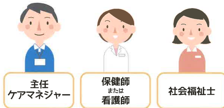
主任 ケアマネジャー