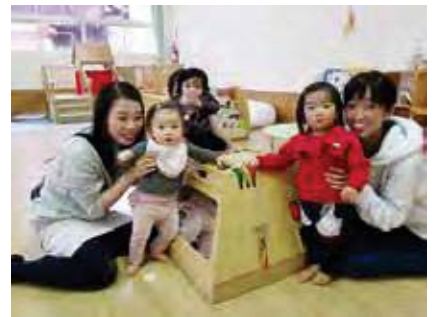
子育て総合センター「子育てひろば」

核家族化や地域のつながりの希薄化などによる、子育ての孤立化を防ぎ、育児不安を解消することで、子育てしやすいまちづくりに取り組みます。