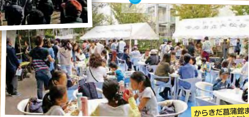
からきだ菖蒲館まつり (2018年)