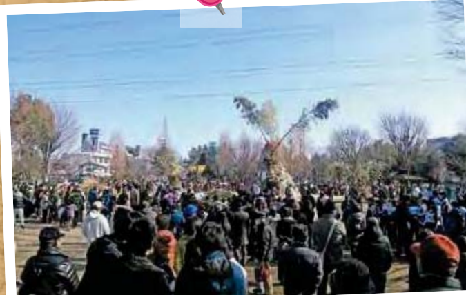
乞田・貝取ふれあい館 どんど焼き (2019年)