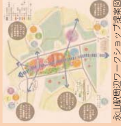
永山駅周辺ワークショップ提案図

永山駅周辺再構築に向け、市民の皆さんとともに永山駅周辺の再構築ビジョンを作成することを目的に、ワークショップを開催しました。