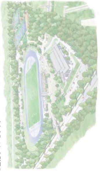
改修後イメージ図

2019年～2020年にかけて、武道館、陸上競技場、庭球場を含めた多摩東公園の大規模改修工事を行い、さらに高齢者や障がい者、子ども連れの方にも利用しやすい施設に整備します。また、指定管理者制度を導入し、民間の目線で効率的な管理運営を目指していきます。