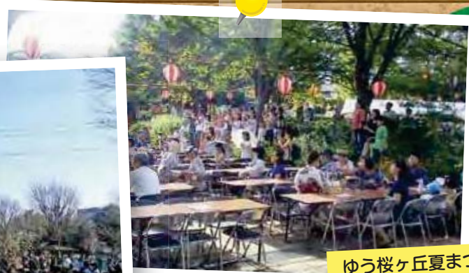
ゆう桜ヶ丘夏まつり (2018年)