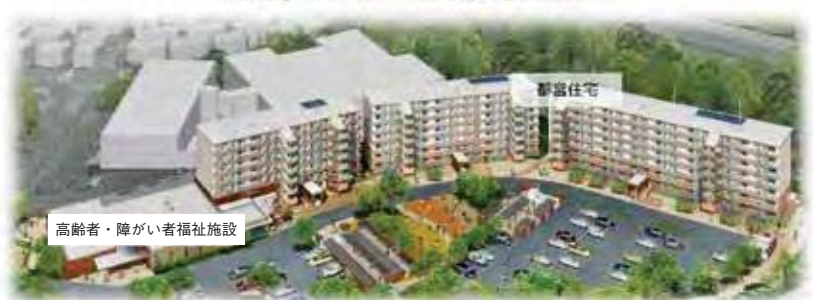
完成予想イメージ(第1-1期 西永山中学校跡地)

障がいのある方が日中に活動する生活介護、就労継続支援（B型）、放課後等デイサービスを行う施設