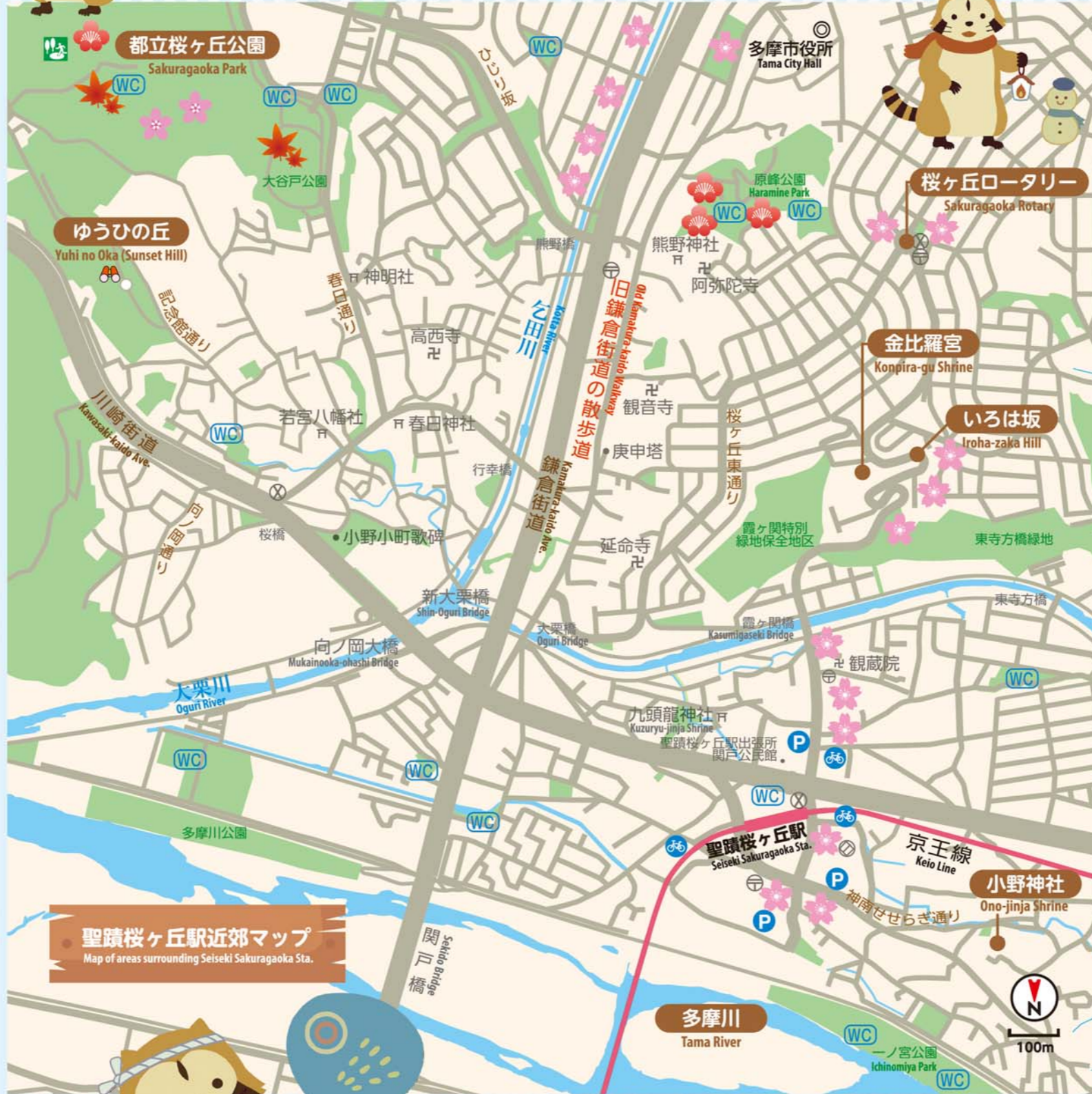
聖蹟桜ヶ丘駅近郊マップ Map of areas surrounding Seiseki Sakuragaoka Sta.