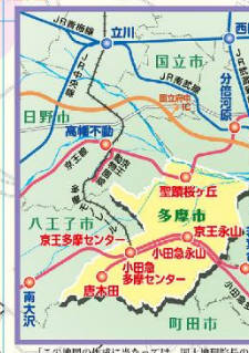
この地図の作成に当たっては、国土地理院院長の承認

ケヤキ並木が赤や黄色に紅葉します。上之根大通りの中間辺りから西へ続く通りです。 見頃 11月上旬～11月中旬 住所 落合2丁目～5丁目 交通 多摩センター駅から徒歩約20分