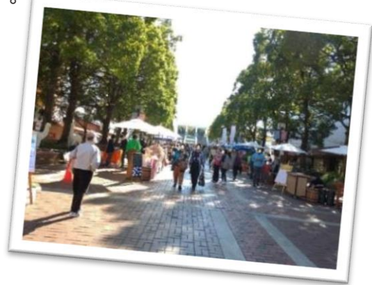
※11月3日のマルシェの様子

※上記は2021年度の予定です。雨天等中止となる場合は、下記多摩センター地区連絡協議会各種SNSに適宜情報掲載します。