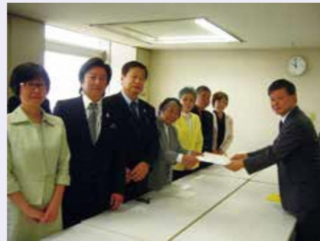
正副議長、生活環境常任委員会ですら意見書を提出

南多摩尾根幹線を事業化計画の優先整備路線に位置づけ必要な検討を行うこと、整備事業の実施に当たっては環境に配慮してほしいことなどを求める意見書を都へ提出。