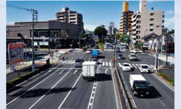
当時の新大栗橋交差点

新大栗橋交差点での交通事故を受け、関係機関へ意見書を提出し、このような事故を二度と起こさせないよう安全対策を講ずることを求めた。市からの働きかけもあり、完全歩車分離式信号機が設置された。