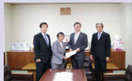
「議会の評価」を市長に提出

決算審査から予算審査までを連動させた予算決算特別委員会が誕生。評価対象事業について議員間の議論に基づき意見集約を行い、「議会の評価」を確定して市長に示すこととなった。