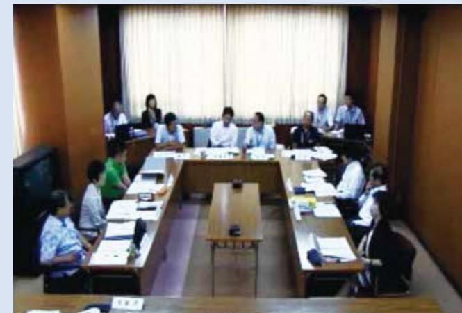
第1委員会室の中継画面

平成26年12月議会より、第1・第2の各委員会室で行う会議についてもインターネット上での配信を開始。