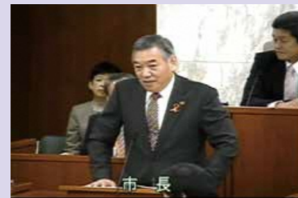
本会議場の中継画面

インターネットを利用した議会中継を平成24年12月定例会から試験的に開始。本会議場の様子を生中継し、閉会中は録画映像を配信。