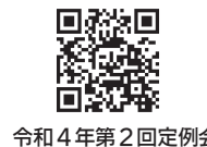
令和4年第2回定例会での一般質問の様子はこちら

A. 多摩市議会ウェブサイトの「一般質問・代表質問」ページに掲載したリンクをクリックすると、各議員の一般質問を冒頭から視聴できます。