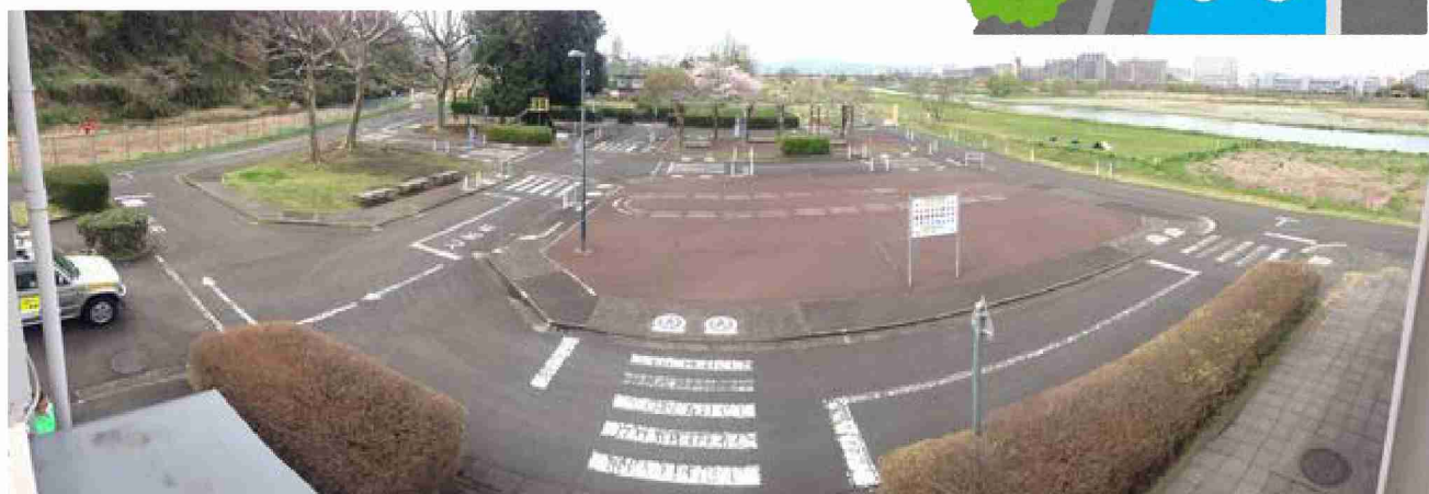
(多摩市立交通公園)