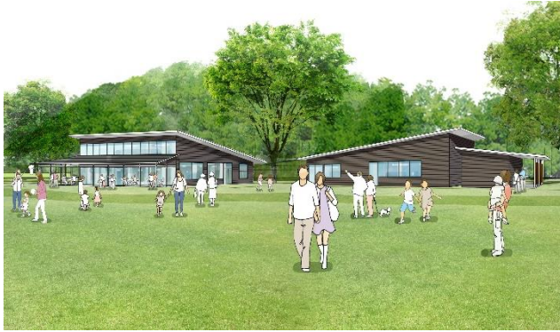
ケヤキハウスのイメージ