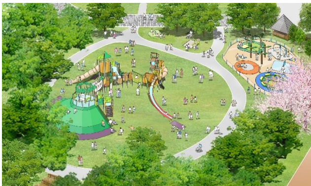
遊びの森（遊具広場）のイメージ