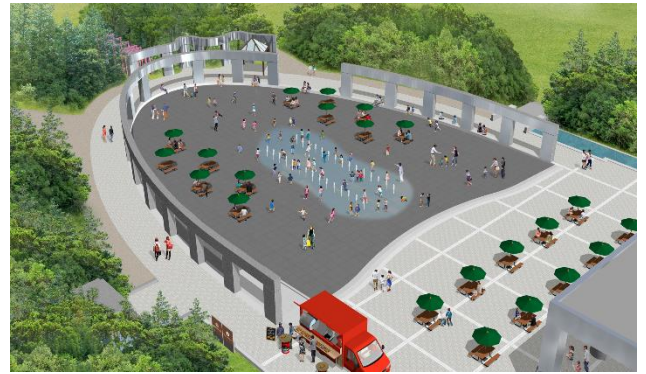
きらめきの広場のイメージ