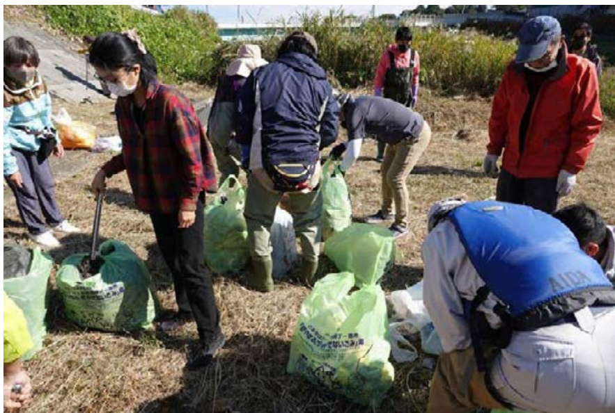
分類後、最後の袋詰め作業