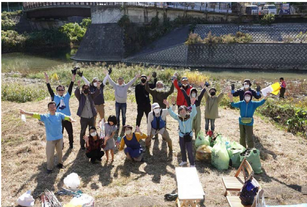
おつかれさまでしたー！