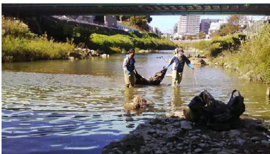
工事用の大きなフレコンバッグが2袋 (+_+)