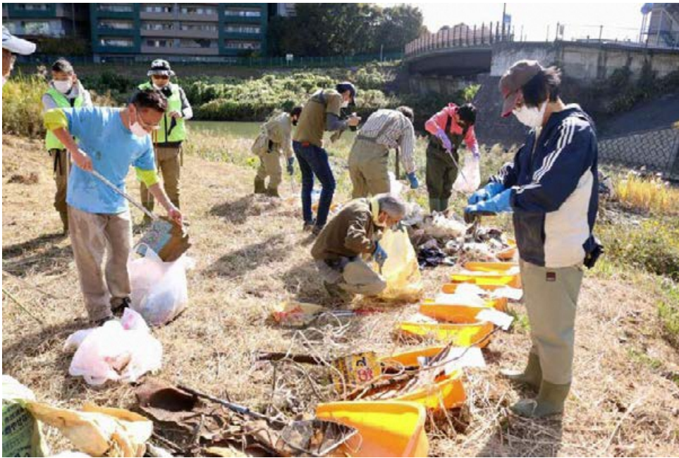
ごみの分類調査風景