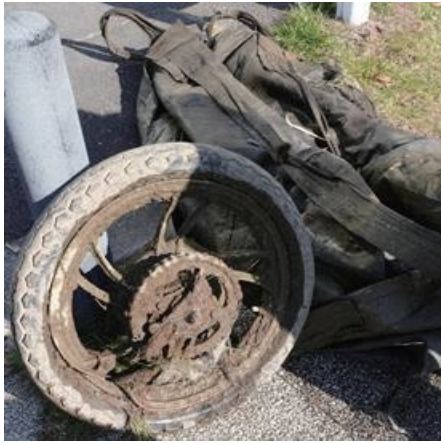
バイクのタイヤにフレコンバッグ。 実は不法投棄のこのタイヤ、市で回収でなく都なんですって！