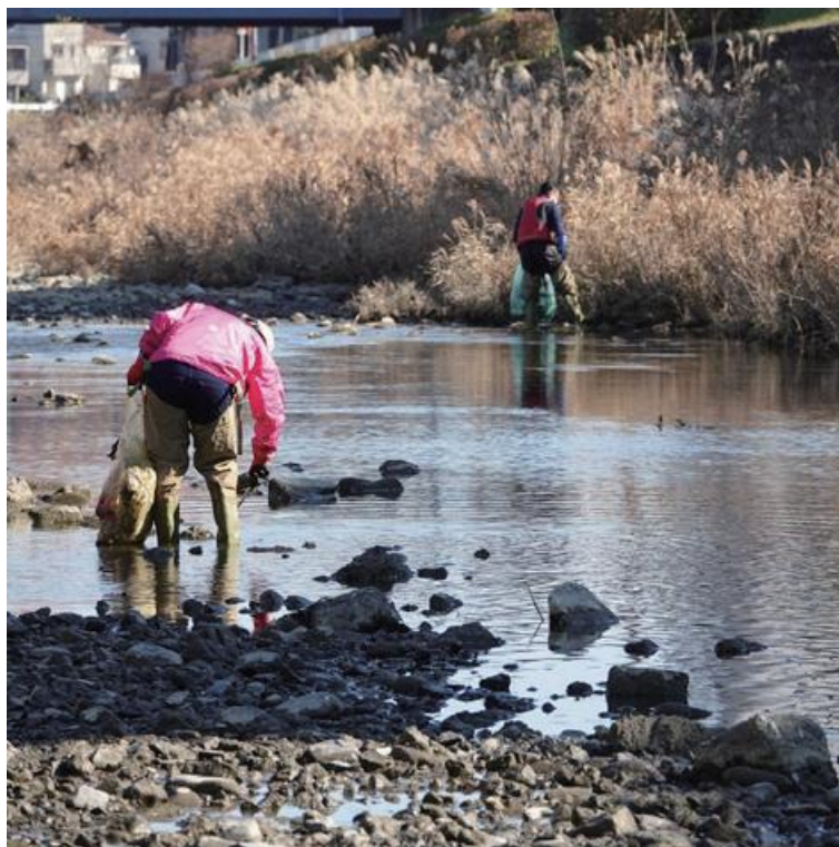
左の方、初参加♪でも雰囲気は手慣れた常連さん( ^o^ )