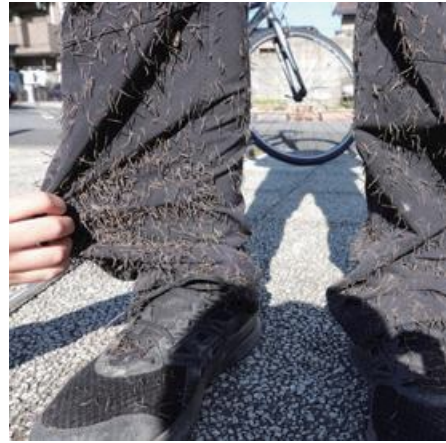
ひっつき虫(センダングサ類の種子)。ツルツルとした服、または胴長靴を推奨