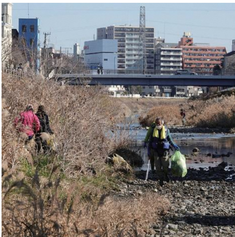
奥は霞ヶ関橋。よ〜く見ると参加者が8〜9名も写ってる! ( ^v^ )