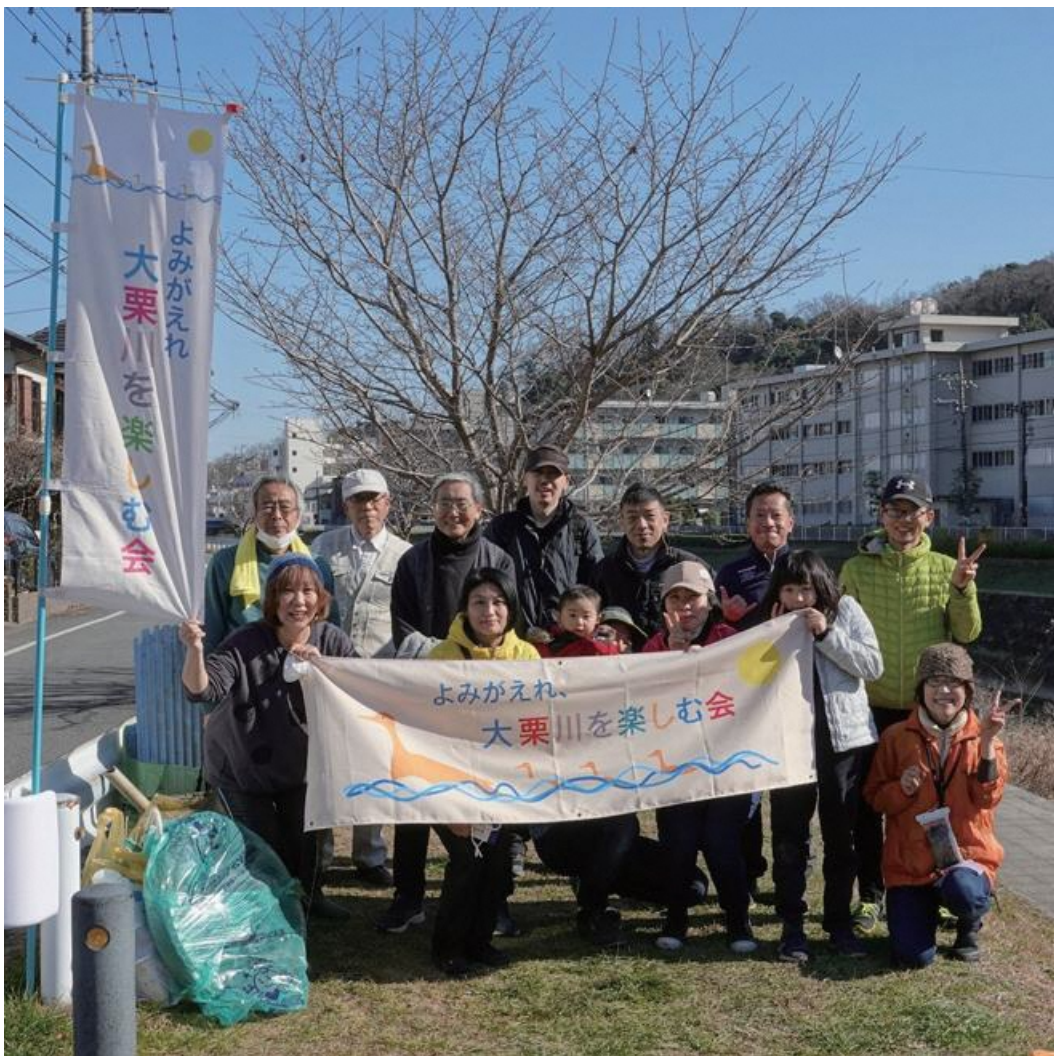
出初式などお正月の行事と重なったせいか、いつもより参加者少なし。うち初参加4名♪ (幼児含む^^)