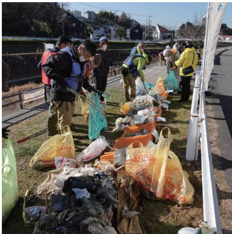
しかし、相変わらず多いですねえ(+_+)