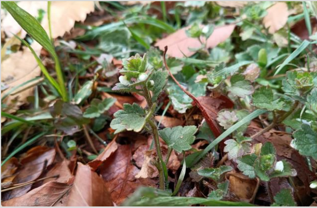
C. コゴメイヌノフグリ(オオバコ科)