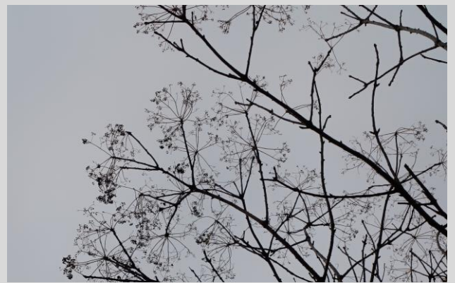
F. ハリギリ(ウコギ科)