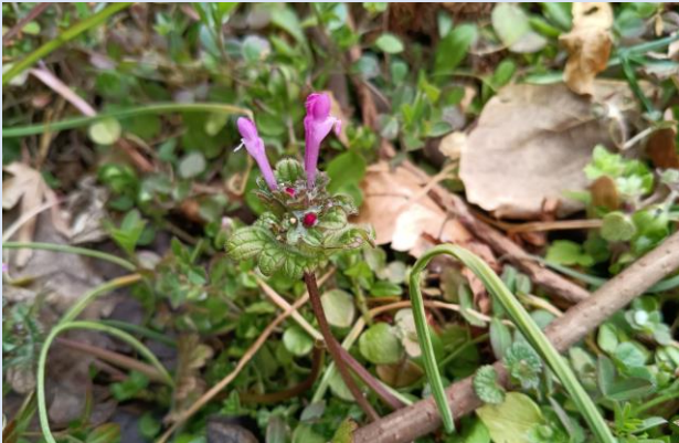
E. ホトケノザ(シソ科)