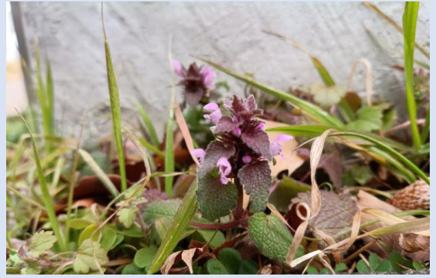
D. ヒメオドリコソウ(シソ科)