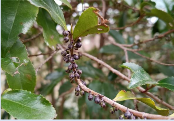
A. ヒサカキ(モッコク科)