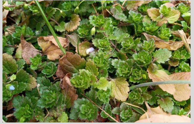
B. オオイヌノフグリ(オオバコ科)