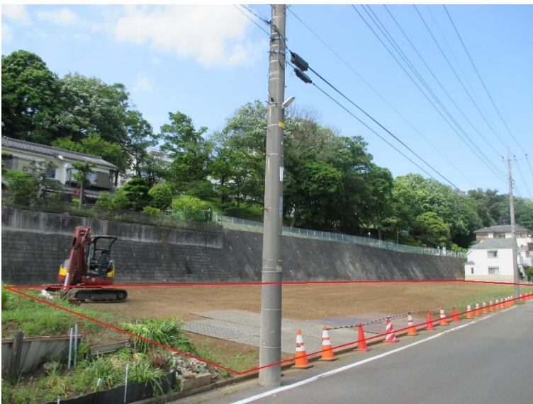
行為制限解除後の状況