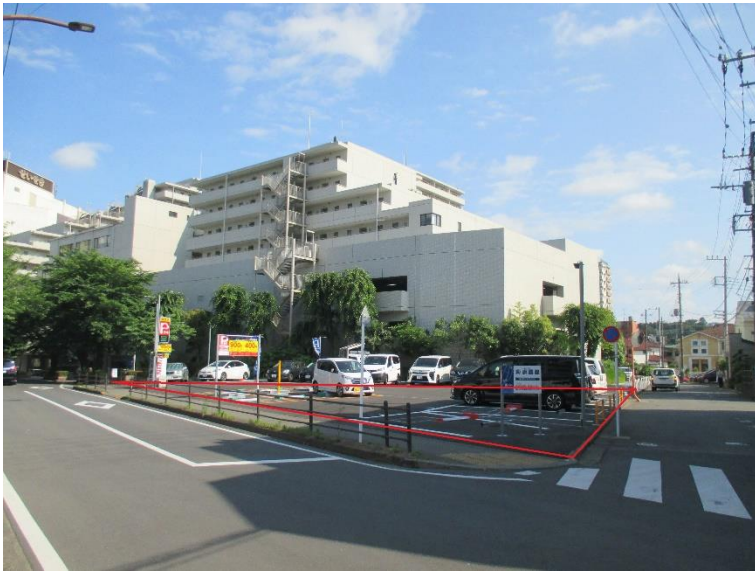
行為制限解除後の状況