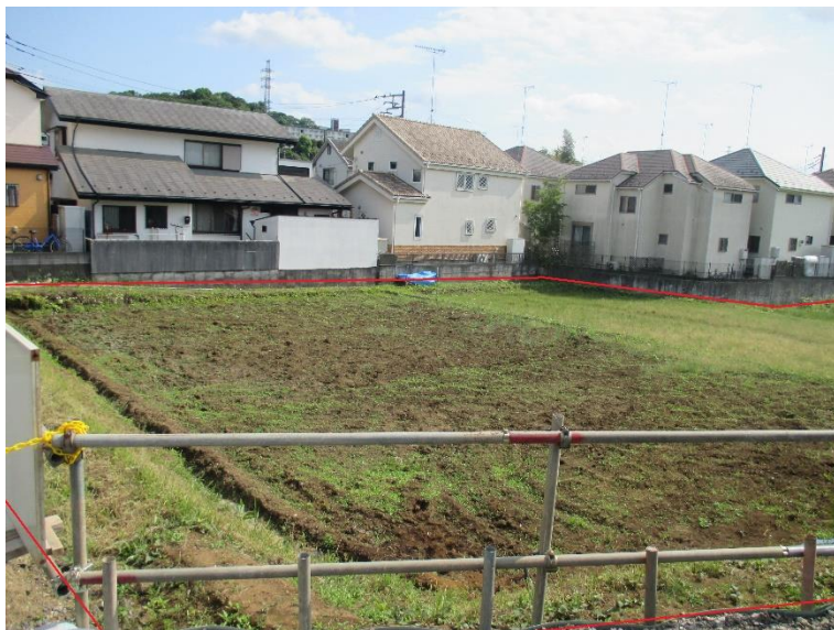
行為制限解除後の状況