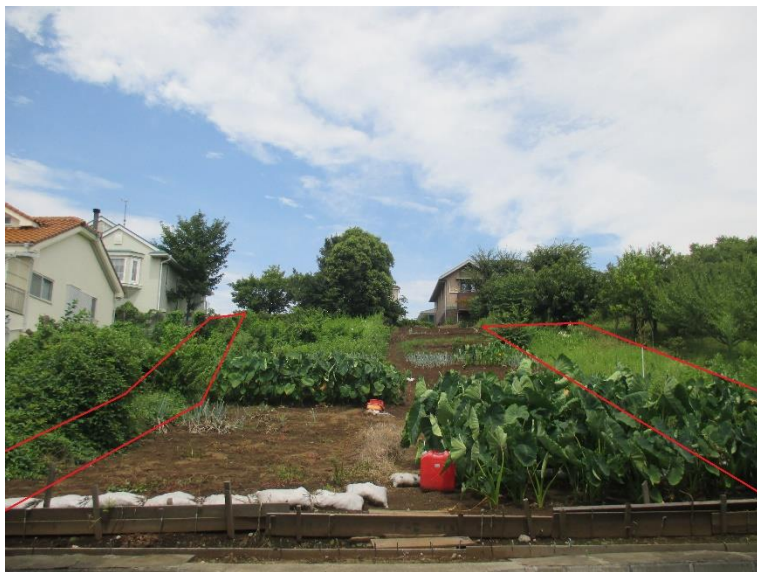
行為制限解除後の状況