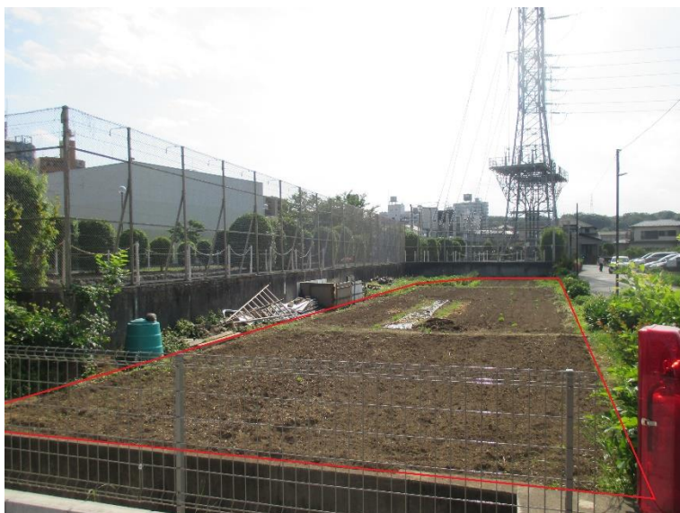
行為制限解除後の状況