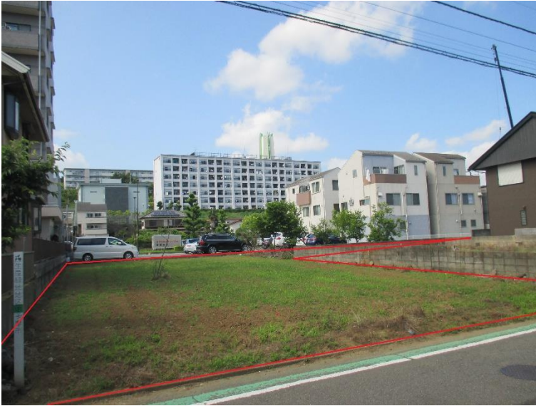
行為制限解除後の状況