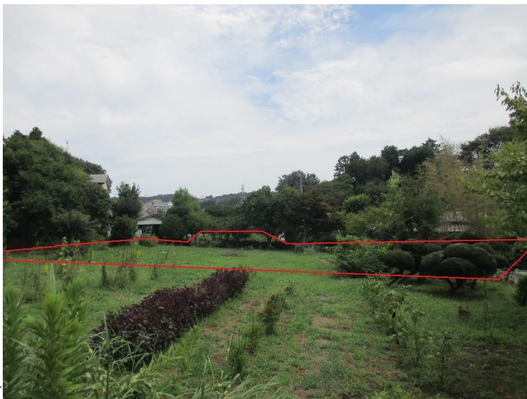
行為制限解除後の状況