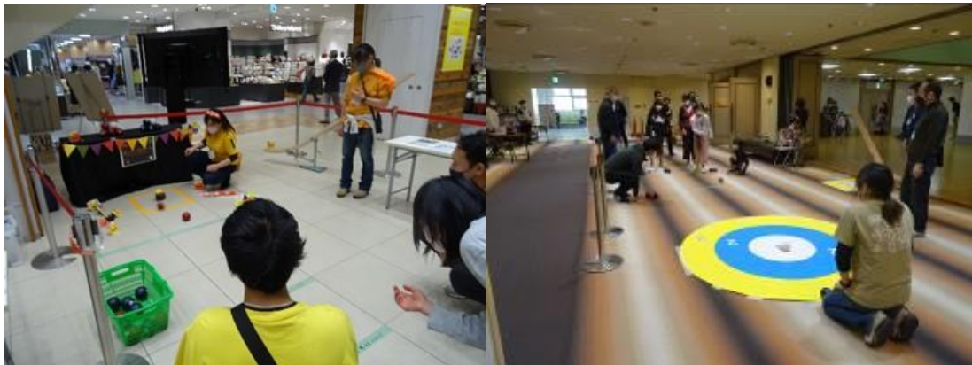
▲過去京王聖蹟桜ヶ丘ショッピングセンターで開催した体験会の様子

※取材を希望される場合は、(1)は2月24日（金）、(2)は3月10日（金）までにスポーツ振興課にご連絡をお願いします。