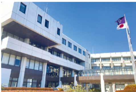
現在の本庁舎。左側がA棟、右側がB棟

災害発生時の防災指令拠点としての機能の整備と、デジタル技術を活用した市民サービスの向上のため、本庁舎の建て替えを行います。