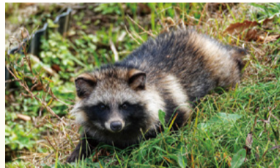
▲タヌキ(令和4年12月撮影)