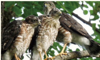
▲ツミのひな鳥(令和4年7月撮影)