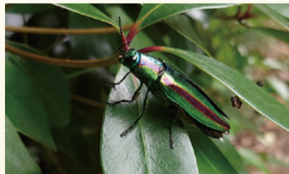
▲タマムシ(令和4年7月撮影)