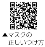
▲マスクの正しいつけ方