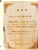
多摩産材の表彰楯▶