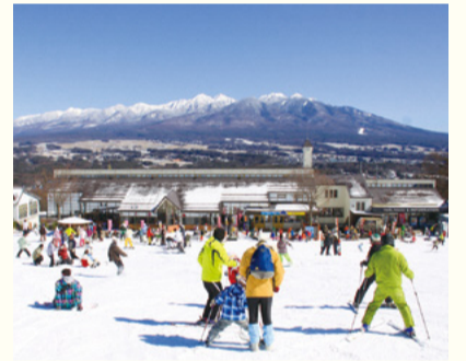
▲富士見パノラマリゾート