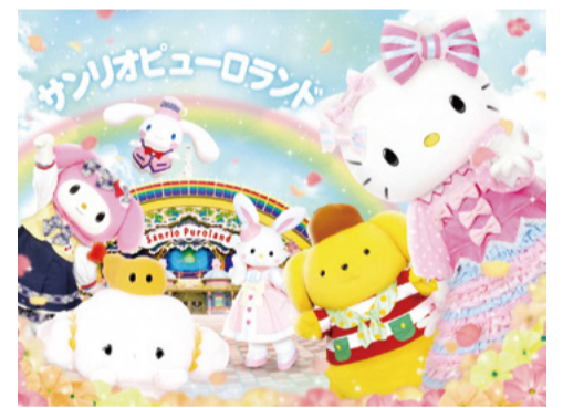
© 2023 SANRIO CO., LTD. APPROVAL No.P1412232 S/F・G

オピューロランド窓口でチケットを購入。専用割引券とチケット購入者の本人確認書類を要提示 備考 詳細は、公式ホームページ参照 閏 サンリオピューロランドゲストセンター ☎(339)1111、市役所経済観光課 ☎(338)6830