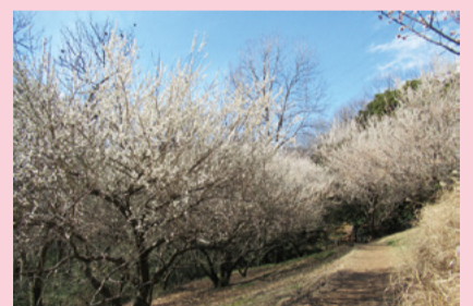
都立桜ヶ丘公園(連光寺5-15)