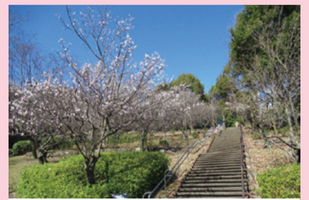
多摩中央公園 梅の谷(落合2-35)