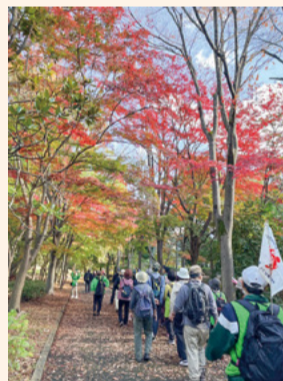
▲多摩さわやかウォーキング大会

日 2月13日(月)午後2時～3時30分 場 健康センター会議室2 備 欠席の場合は個別対応可 申 1月23日(月)～2月7日(火)に、公式ホームページのインターネット手続きまたは電話で、健康推進課へ