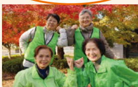
▲関戸・一ノ宮地区推進員メンバー