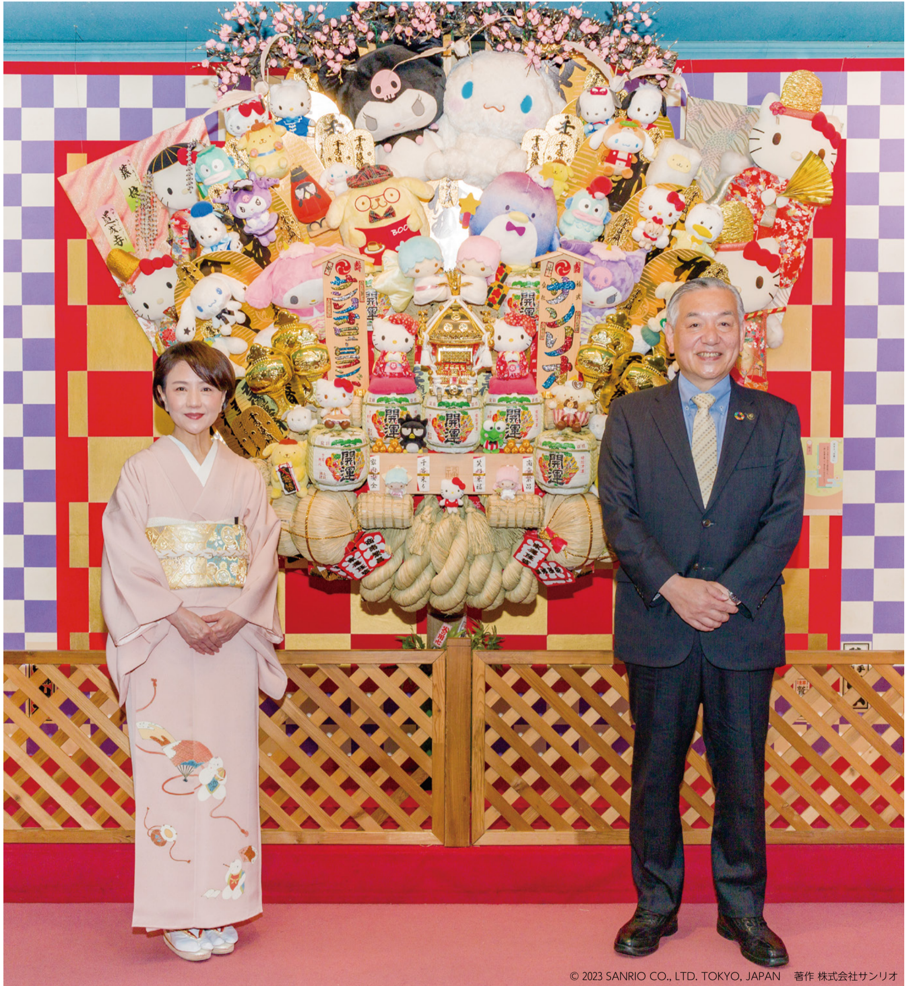
© 2023 SANRIO CO., LTD. TOKYO, JAPAN 著作 株式会社サンリオ