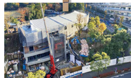
屋根の下地部分の工事が終わりました。あわせて内装・設備工事なども進めています。 11月25日撮影