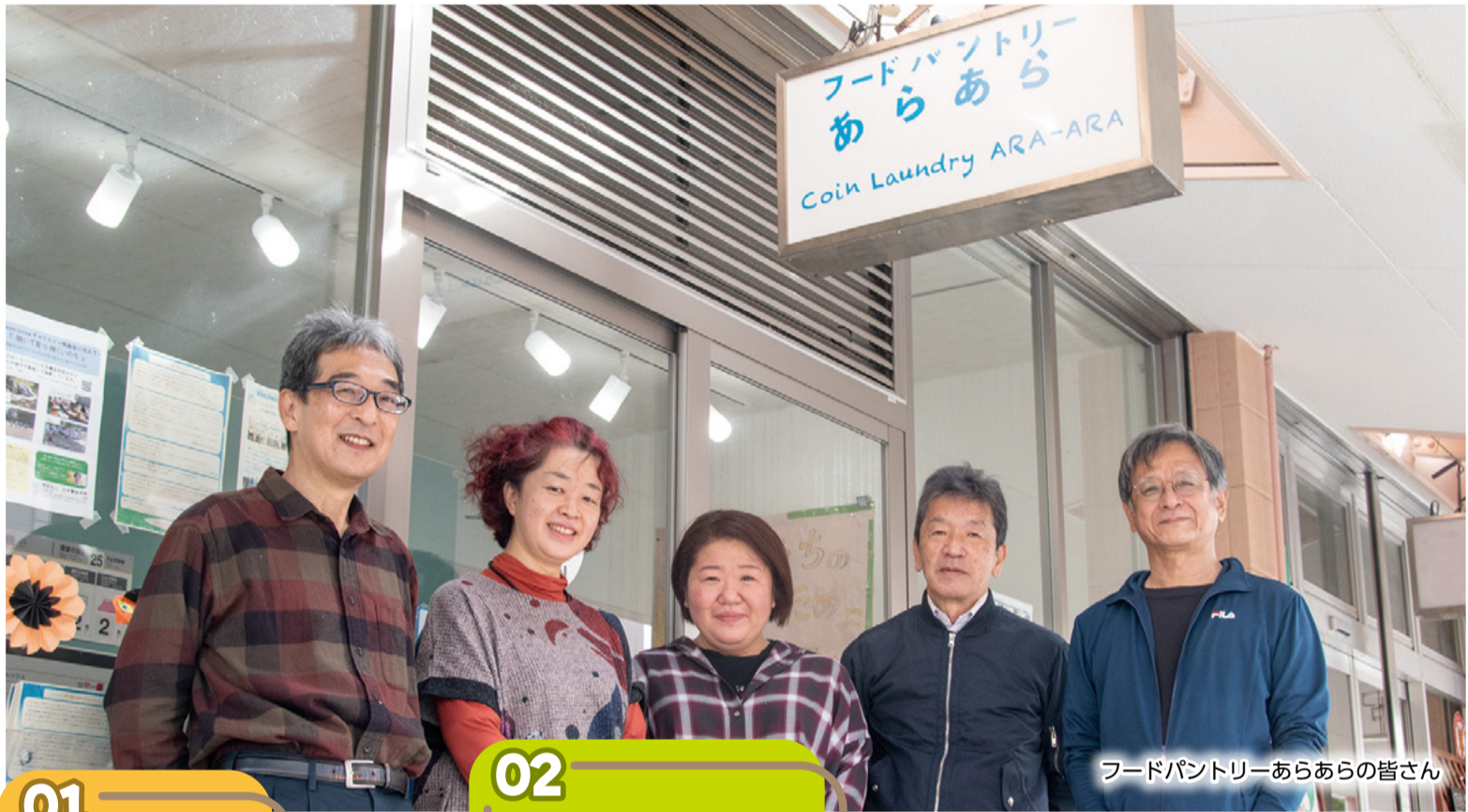
フードパントリーあらあらの皆さん