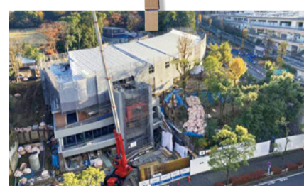
屋根の下地部分の工事が終わりました。あわせて内装・設備工事なども進めています。 11月25日撮影