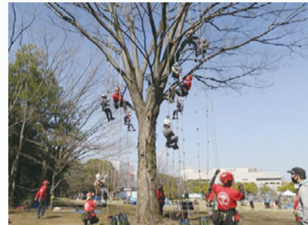
▲パークライフショー