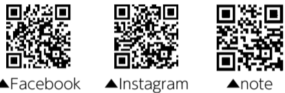
▲Facebook ▲Instagram ▲note

聖蹟桜ヶ丘かわまちづくり協議会とは、多摩川を活用したまちの魅力づくりと賑わいのある河川空間を目指して、地域の自治会・団体・事業者により発足した団体