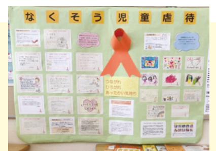
▲昨年の展示の様子