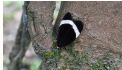
▲ホタルガ(令和4年6月撮影)

このコーナーでは、市民の皆さんから投稿いただいた市内の動物や植物を紹介します。 環境政策課(338)6831、(338)6857