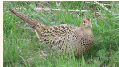
▲キジ メス(令和4年3月撮影)