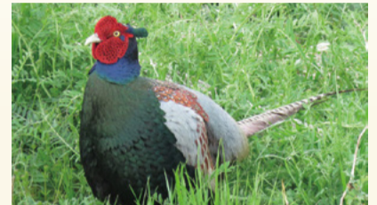
▲キジ オス(令和4年3月撮影)