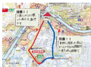
▲避難経路図のイメージ