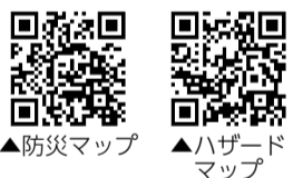
▲防災マップ ▲ハザードマップ