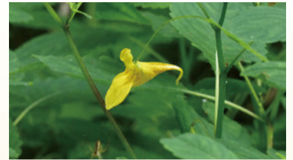
▲キツリフネソウ(令和4年6月撮影)