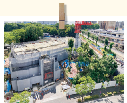
屋根部分の工事が進んでいます！