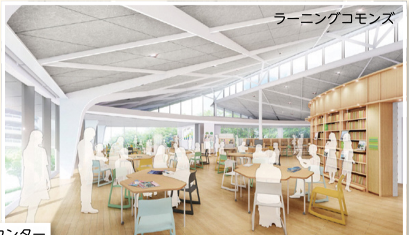
ラーニングコモンズ

中央図書館には、図書館としての機能の他に、さまざまな学びや活動に対応する新しいスペースがあります。今回は「ラーニングコモンズ」と「ステッププラザ」、「サテライトカウンター」をご紹介します。