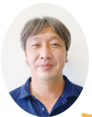
山崎地域教育力支援コーディネーター

市内全域で行われているこれらの活動を「地域教育力支援コーディネーター」が統括し、地域の方・企業・団体と学校をマッチングしています。教育指導課では、市の未来を担う子どもたちの教育にご支援・ご協力いただける地域の皆さんからの連絡をお待ちしています。個人・法人(団体)問わず、地域学校協働活動にご興味のある方は、教育指導課へ気軽にお問い合わせください！