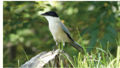
▲オナガ(令和4年6月撮影)

このコーナーでは、市民の皆さんから投稿いただいた市内の動物や植物を紹介します。 環境政策課 ☎(338)6831、☎(338)6857