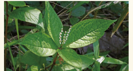
▲フタリズカ(令和4年5月撮影)