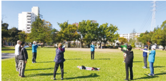
▲青空の下でみんなで体操

☎10月31日(月)午前9時30分～午後0時30分(午前11時30分まで受け付け。雨天中止) ☎場 永山南公園・永山団地名店街(永山4-2) ☎対象 おおむね65歳以上の高齢者 ☎簡単な問診、指輪っかテスト、測定(片足立ち時間、歩く速さなど)、簡単な体操などの体験コーナー ☎備考 動きやすい服装と靴で ☎当日直接会場へ