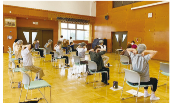
▲自宅の近くだから続けやすいです

「季節に応じて、野の花で生け花、木の実でリース作りなどを取り入れています♪」「天気の良い日は外で活動するなど、工夫して毎週集まっています！」