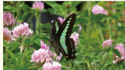
▲アオスジアゲハ(令和4年5月撮影)