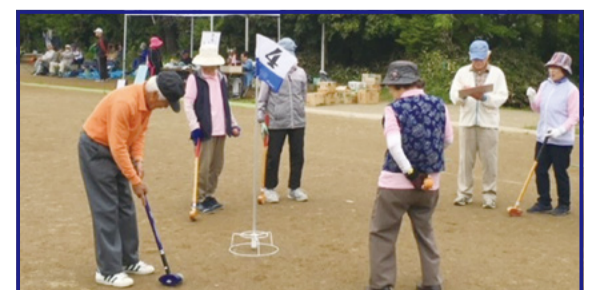
▲みんなと一緒に活動することは健康維持に役立っています！

☎多摩市老人クラブ連合会事務局 ☎(356)0309(平日午前9時30分～午後4時30分)