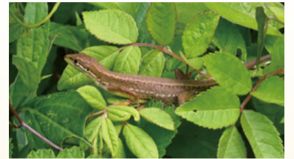
▲ニホンカナヘビ(令和4年6月撮影)