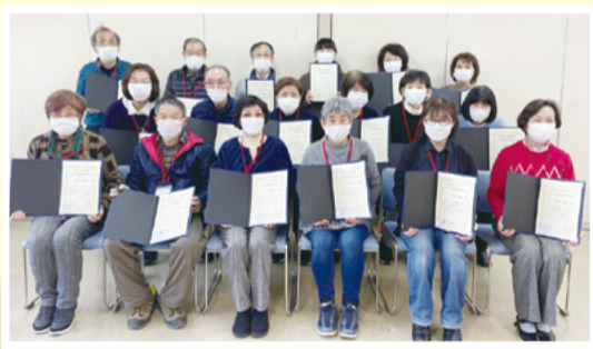
▲介護予防リーダーは地域で体操を教えるなど活躍しています！