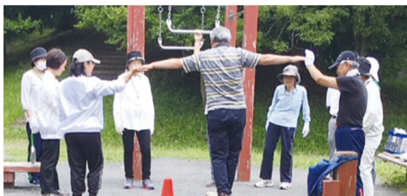
▲普段と違う体の使い方ができます

☎①9月8日(木)午前10時30分 ②10月6日(木)午前10時 ☎場 ①豊ヶ丘南公園 ②乞田・貝取ふれあい広場公園 ☎公園の運動遊具を使った体操(②は乞田・貝取ふれあい館で体力測定を実施)。地域指導員が丁寧にサポートします ☎備考 各公園で毎月1回開催。日程は要問い合わせ ☎当日直接会場へ