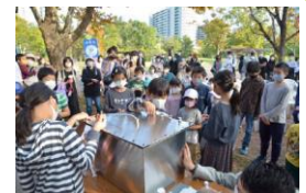
新たなタイムカプセル