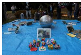
埋設されていた記念品

市制施行50周年記念誌 令和3年12月1日刊行 A4サイズ、220ページフルカラー