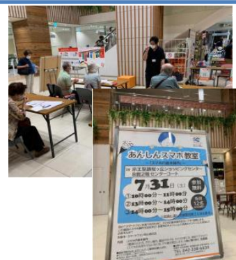
京王聖蹟SCセンターコート即席会場

初めてスマートフォンを使う! もう少しスマホを活用したい! そんな方のために、電話のかけ方などスマホの基本操作、アプリの使い方、キャッシュレス決済についてなどの講習会を聖蹟桜ヶ丘や多摩センターなど各事業者の協力の基、さまざまな場所で随時開催いたしました