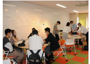
ワークショップ状況

市では、新しいブランドビジョン「暮らしに、いつもNEWを。」を具現化するため、「未来洞察(フォーサイト)」という研究手法において先端事案を手掛ける国立大学法人一橋大学と連携し、近未来である10～20年後の多摩市の都市像に関する調査研究をスタートさせました。