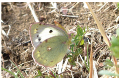
▲モンキチョウ♀(令和4年3月撮影)