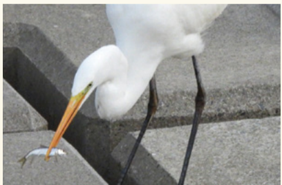
▲ダイサギ(令和4年1月撮影)