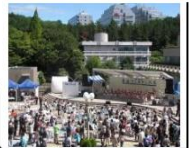
観客者 テント 控室 テント