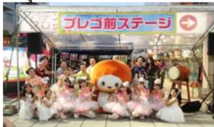
プレゴ前ステージ 横幅5m奥行3.6m