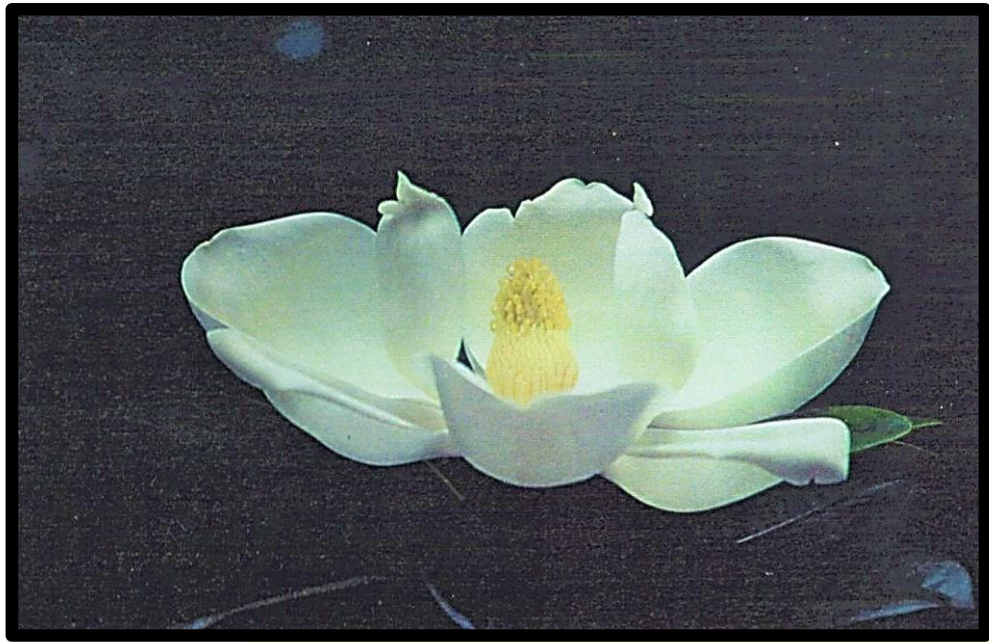
「タイザンボク(花)」(撮影:多摩市貝取)