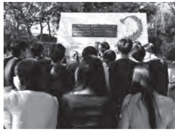
「ひめゆりの塔」前にて

都立永山高等学校3年生は昨年、平和学習の一環として沖縄に修学旅行に行きました。沖縄戦で県土の9割が破壊された住民の惨劇、悲惨さを知りました。平和の大切さを作文を通して皆さんに伝えます。