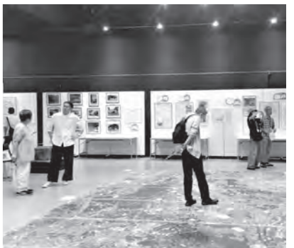
2025年の本展示コーナー風景

かつて稲城市と多摩市にまたがって旧日本陸軍の火薬工場があり、その後は「米軍多摩弾薬庫」、現在は「米軍多摩サービス補助施設」となっています。その90年近くに及ぶ歴史と経緯が一望できます。新たな展示物を出品予定!