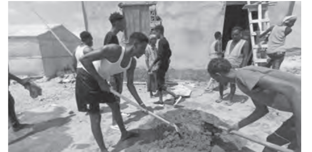
ソマリアにて地域コミュニティ向けの建設作業に参画する元戦闘員(2024年)