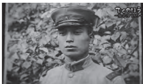
ドキュメンタリー作品 山形放送 2023年 ディレクター・撮影：伊藤翼