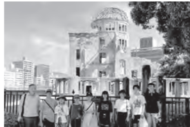
令和7年度 子ども被爆地派遣の様子

令和7年度に多摩市子ども被爆地(広島)派遣事業に参加した市内小中学生8名の作文と活動アルバムを展示します。