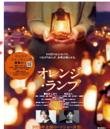
2023年全国ロードショー決定！ 映画『オレンジランプ』の製作スタッフが開る 認知症とともに生きる人々へ希望と再生の物語

発症の初期の段階から、その症状・社会的立場や生活環境などの特徴をふまえて、可能な限りできることを続けながら、適切な支援を受けられる取り組みが進められています。