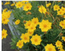
オオキンケイギク