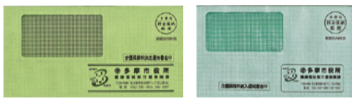
▲決定通知書用封筒