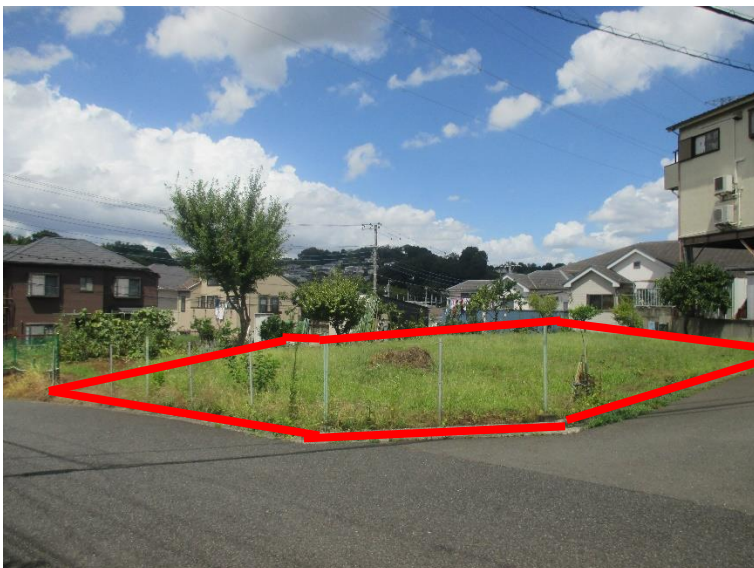
行為制限解除後の状況