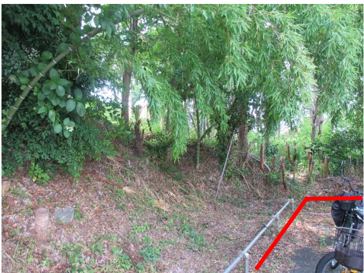
行為制限解除後の状況