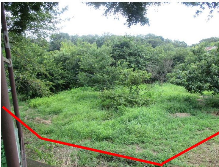
行為制限解除後の状況