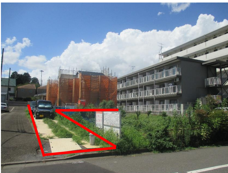
行為制限解除後の状況