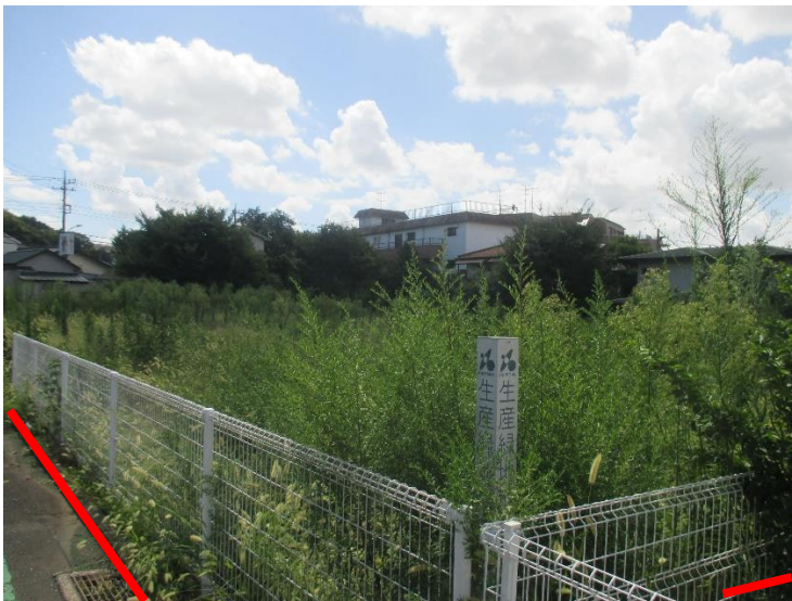
行為制限解除後の状況