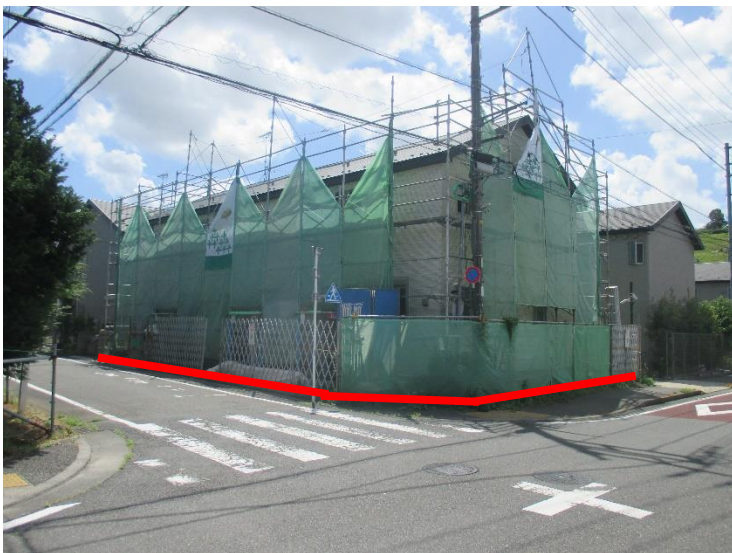
行為制限解除後の状況