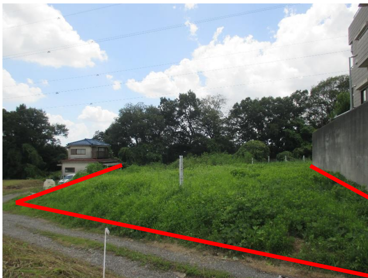
行為制限解除後の状況