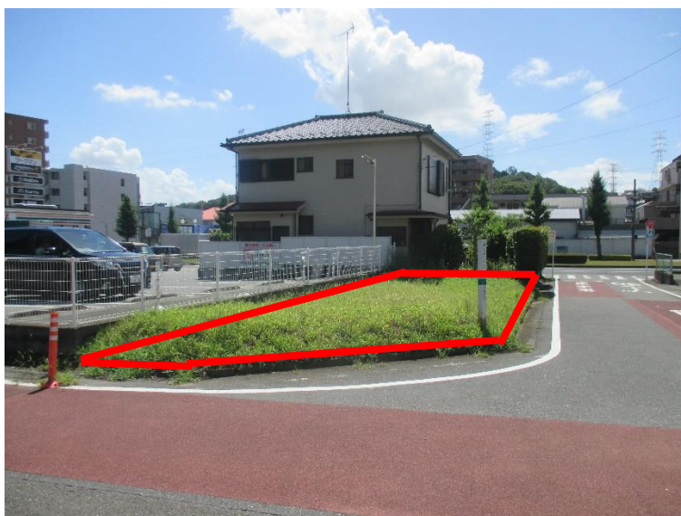
行為制限解除後の状況