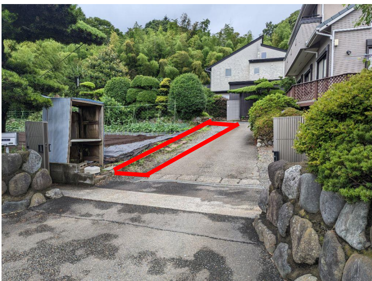
行為制限解除前の状況