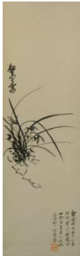
三条実美筆 東久世通禧賛 「蘭竹之図」 紙本墨画 一幅