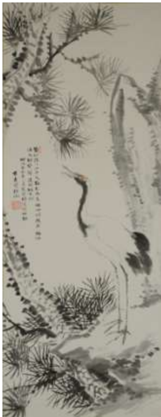
秋月種樹自画讃 「松下鳴鶴之図」 紙本墨画 一幅