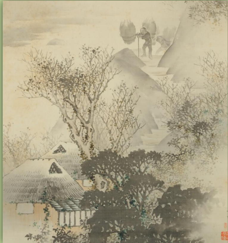
熊谷直彦「山水之図」 第四回内国勸業博覧会出品