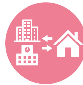
関係機関と 連携した支援