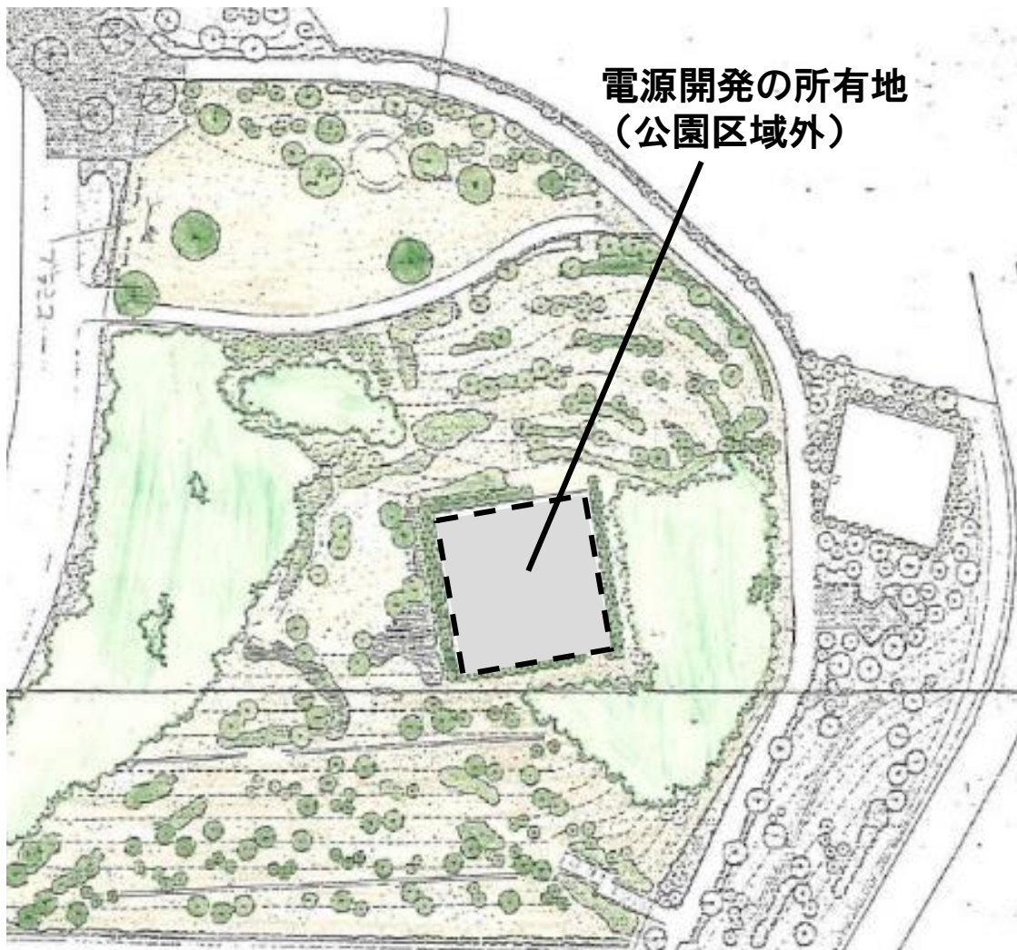
鉄塔建て替え工事前