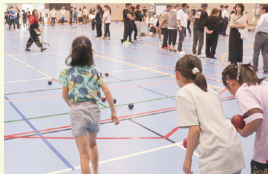
▲ポッチャ大会の様子

どんな人でも楽しめるユニバーサルスポーツであるポッチャ・スポーツ輪投げ・太極拳体験。ボランティアさんと一緒に昔遊び、マジック、絵手紙体験など。当日は来場者みんなでギネス記録に挑戦する企画も開催。