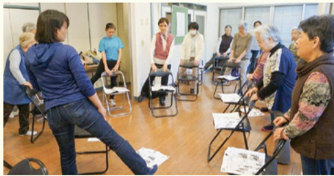
▲近トレ活動の様子

地域で行われているサークル活動(サロン、近トレなど)やボランティア活動紹介。これから活動を始めてみたい方の相談会。