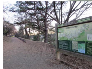
歴史の道100選に認定された「多摩よこやまの道」