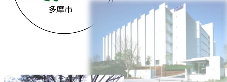
立地企業イメージ